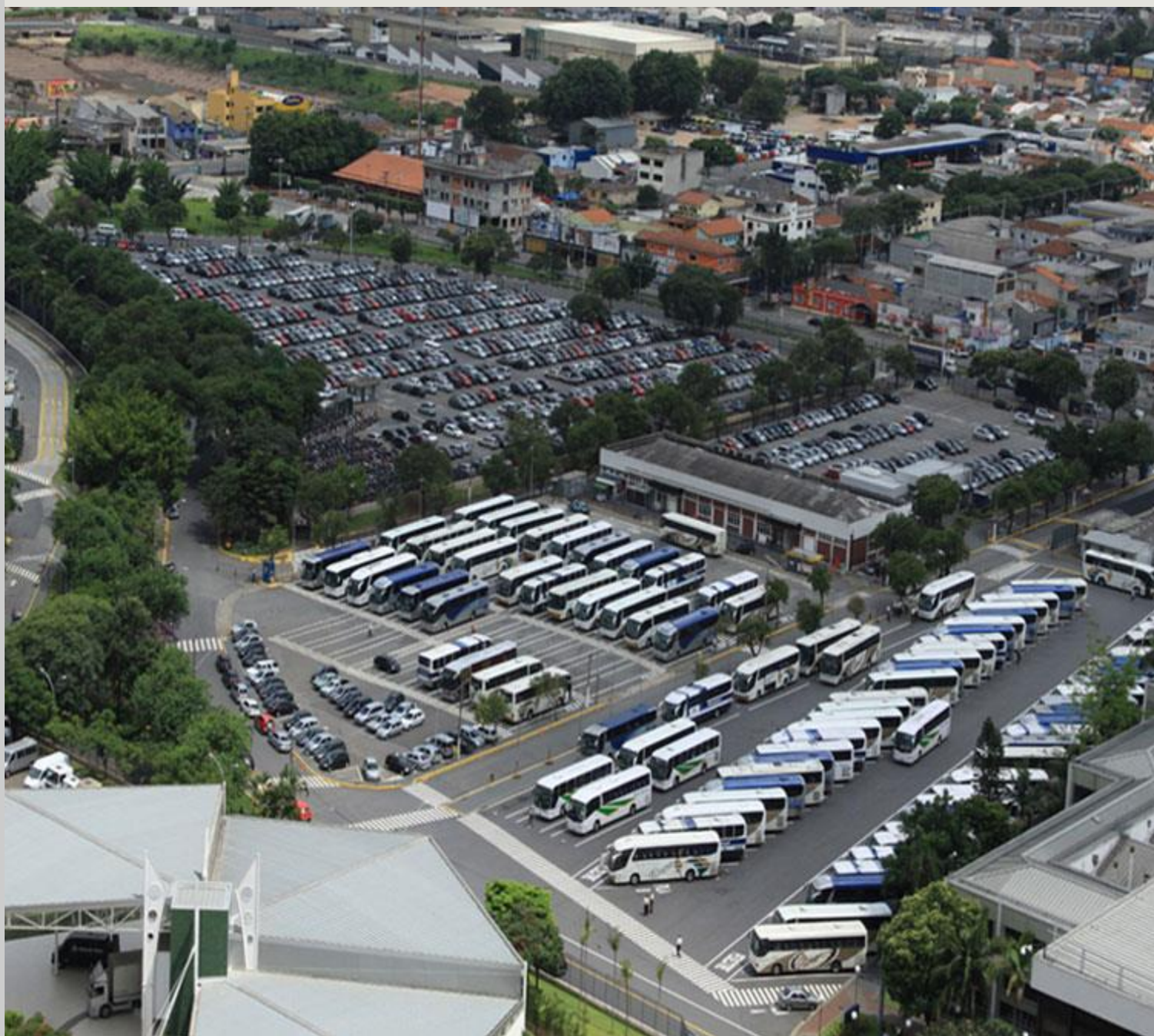
Figura 2.13: Pátio de estacionamento dos ônibus na MBB de São Bernardo do Campo.